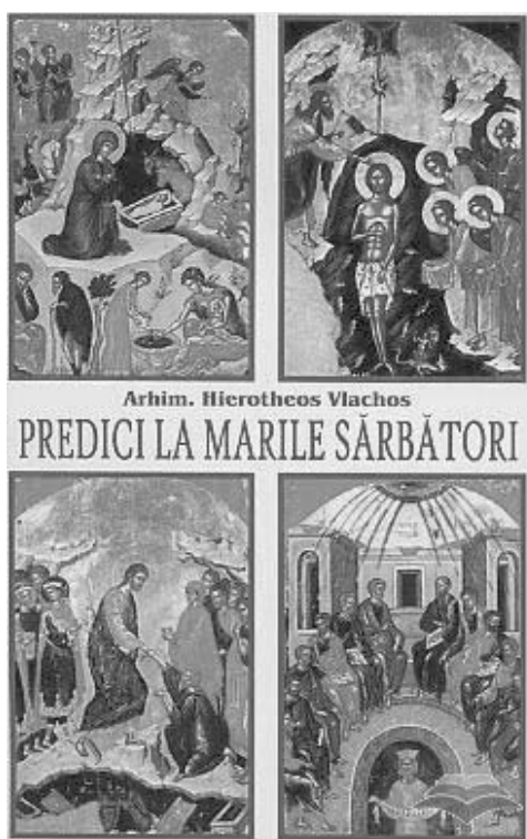
Arhim. Hierotheos Vlachos

Pogorârea Sfântului Duh s-a făcut în zi de duminică. Din acest fapt înțelegem importanța duminicii, pentru că cele mai mari evenimente împărătești au avut loc în această zi. După cum spune Sfântul Nicodim Aghioritul, în prima zi, adică duminică, a început zidirea lumii, pentru că atunci a fost creată lumina. De asemenea, în zi de duminică a început reînnoirea creației, prin Învierea lui Hristos, și tot în zi de duminică s-a desăvârșit reînnoirea creației prin pogorârea Duhului Sfânt. Crearea lumii s-a făcut de către Tatăl împreună cu Fiul și cu Duhul Sfânt, reînnoirea s-a făcut de către Fiul, prin bunăvoința Tatălui și prin participarea Sfântului Duh, iar desăvârșirea zidirii s-a făcut de către Duhul Sfânt, Care purcede din Tatăl și este trimis prin Fiul.